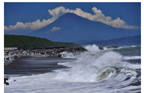
葛飾北斎 浮世絵風景画 「駿河湾富嶽三十六景」 —第二十七景—焼津市吉永海岸

ホストタウン交流も交え、市一体でおもてなし意識が高いことを表現し、大会後のインバウンド拡大を図っていきます。